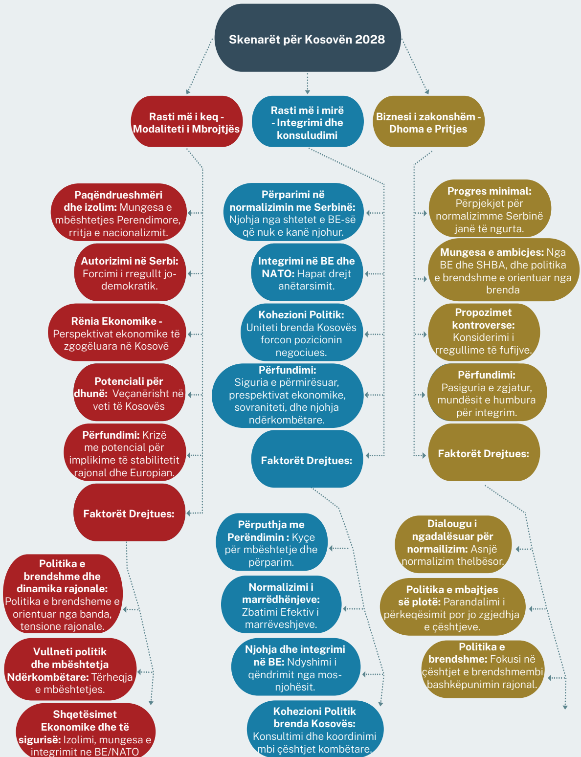
Figure 2: Mindmap of Kosovo 2028